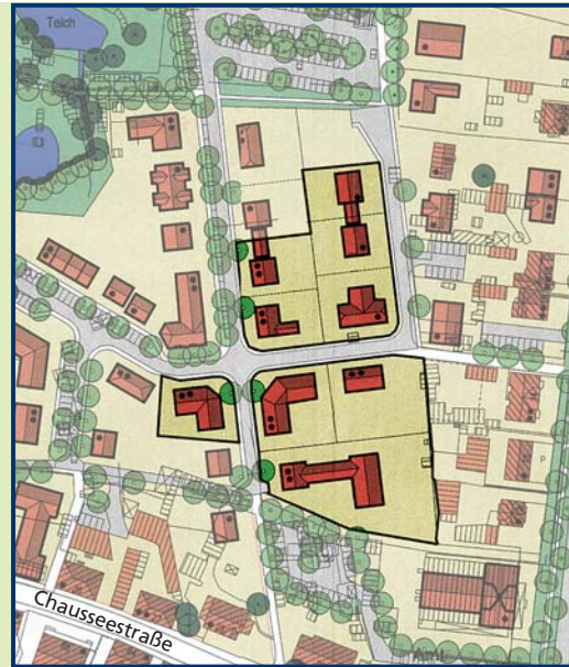
1. BA Erschließung „Schwarzer Damm“