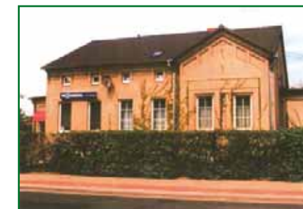
ulica Chausseestraße 28 straciła na przestrzeni dziejów większą część swojego pierwotnego stylu