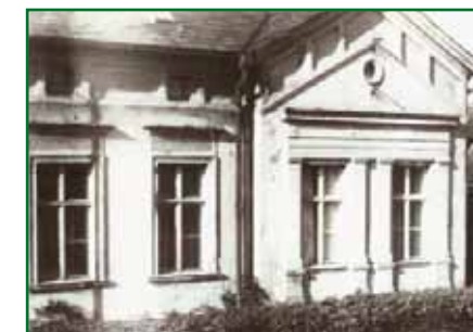
historyczne zdjęcie ulicy Chausseestraße 28

Zgodnie z propozycją planisty ramowego, dzięki aktualnemu porządkowaniu i modernizacji miasta, byłoby możliwe odtworzenie pierwotnego wdzięku domu przy ulicy Chausseestraße.