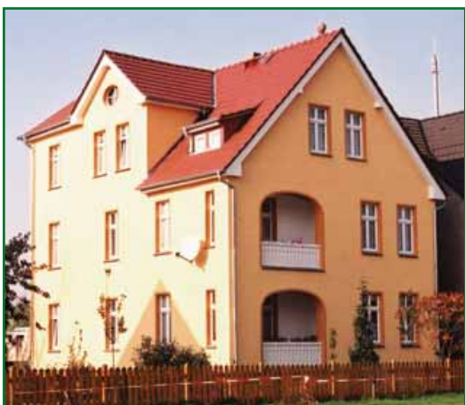
2 Ernst-Thälmann-Straße 15