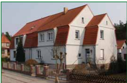
5 Erwin-Fischer-Straße 8/9

Prywatne inwestycje, które były przeciętnie dotowane w 40%, przyciągają dzięki temu dodatkowe inwestycje właścicieli wynoszące ok. 60%.