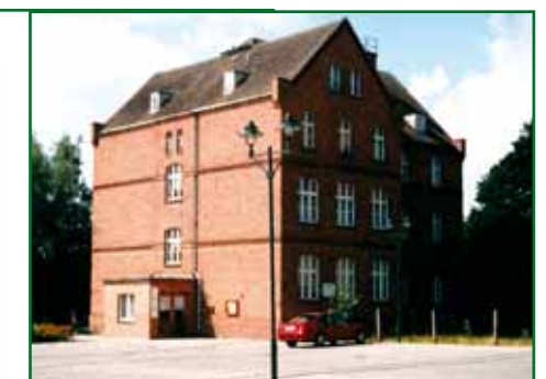
7 Stara szkoła

Oprócz tego było również możliwe wspieranie „sztuki związanej z budownictwem”. Między innymi w ten sposób powstała płaskorzeźba z brązu „Rozwiane liście”, która oddaje cześć historii gminy Löcknitz w okresie czasu od roku 1100 do roku 2000 n.e.