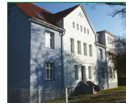
3 Chausseestraße 37