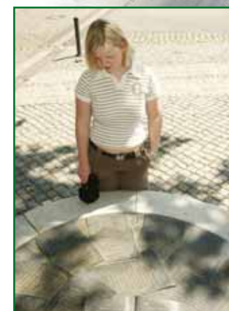
6 Płaskorzeźba z brązu na rynku