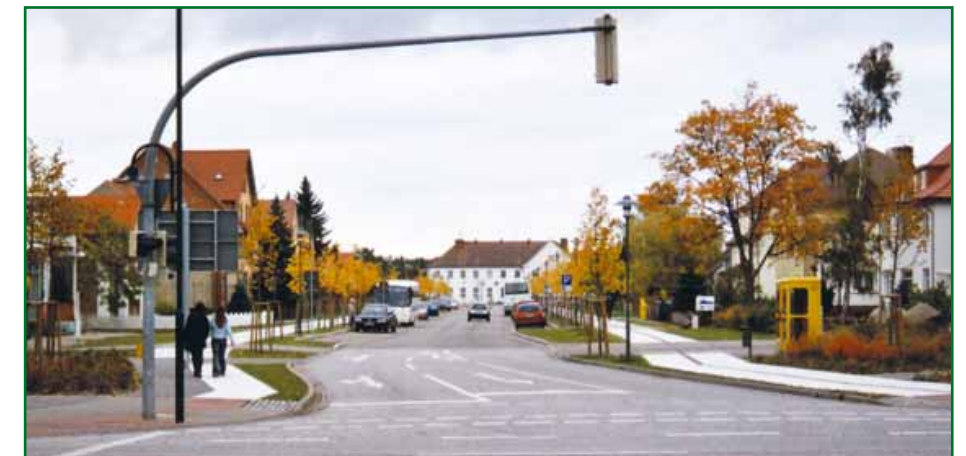
1 Uzbrojenie ulicy Ernst-Thälmann-Straße