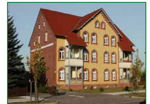
4 Ernst-Thälmann-Straße 14

Również na rynku „coś się dzieje”. „Stara szkoła” jest przebudowywana i remontowana na „dom dla obywateli”. Oprócz biblioteki i biura ds. modernizacji starzy i młodzi mieszkańcy Löcknitz będą mieli w przyszłości w centrum naszej gminy pomieszczenie do pracy i działalności twórczej.