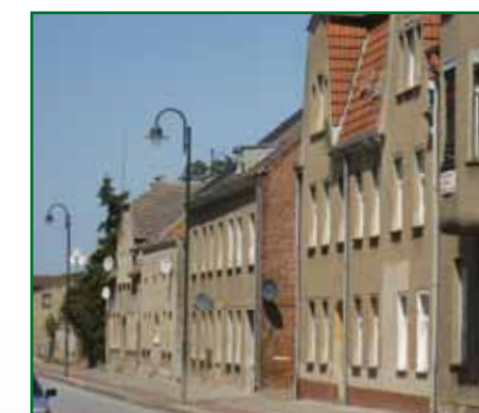
4 Rząd domów przy ulicy Chausseestraße 8-12