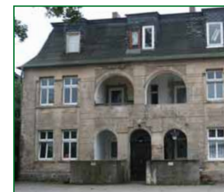
1 Willa Chausseestraße 71