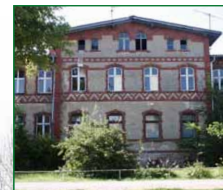
3 Willa Chausseestraße 72

Poprzez realizację wielu prywatnych i publicznych przedsięwzięć modernizacyjnych wizerunek miejscowości Löcknitz się bardzo pozytywnie zmienił. Jednakże wiele jest jeszcze do zrobienia. Obiekty, które muszą pilnie zostać poddane modernizacji, to np. wieża ciśnień, dom towarowy, budynek na ulicy Chausseestraße i różne trakty uliczne.