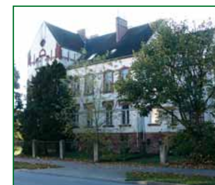
2 Chausseestraße 69