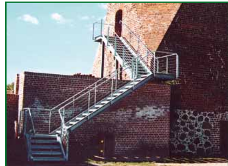
część schodów (wejście na wieżę)