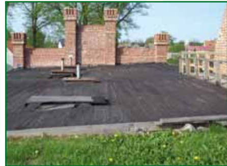
zadaszenie byłej lodowni