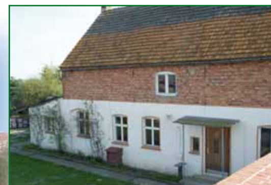
Budynek Schloßstraße 2 (dom Wulkow)

Na początku chodzi przede wszystkim o to, aby wstrzymać rozpad sklepień poprzez działania zabezpieczające. Dzięki budowie nowej powierzchni zieleni na dachu ta część budynku jest chroniona przed wtargnięciem wody. Sklepienie piwniczne może być już obecnie wykorzystywane przez gminę.