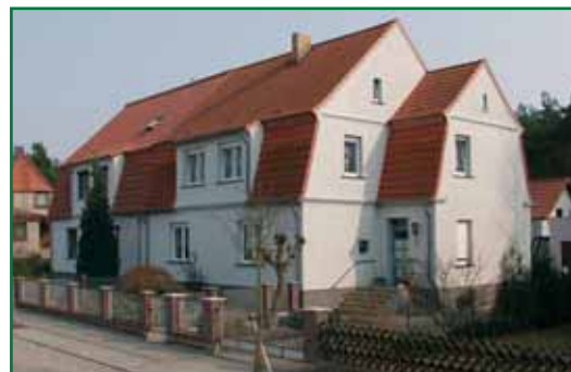
5 Erwin-Fischer-Str. 8/9