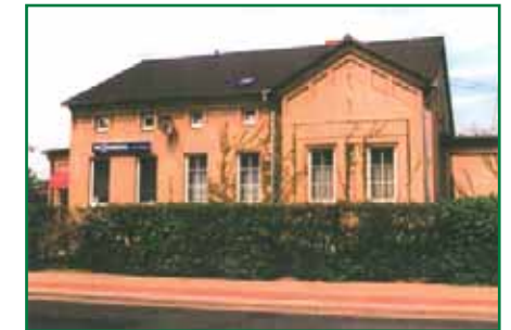
Die Chausseestraße 28 hatte große Teile ihres ursprünglichen Baustils im Laufe der Jahre verloren