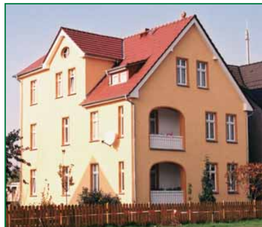
2 Ernst-Thälmann-Str. 15

D.h. Investitionen ziehen weitere Investitionen nach sich und sorgen für wirtschaftlichen Aufschwung in der Region.