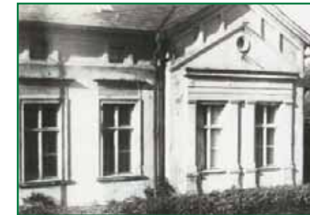
Historische Aufnahme der Chausseestraße 28

Nach einem Vorschlag durch den Rahmenplaner konnte mit der aktuellen Sanierung der Baustil und damit der ursprüngliche Charme des Hauses an der Chausseestraße wieder hergestellt werden.