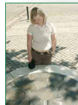
6 Bronzerelief auf dem Markt