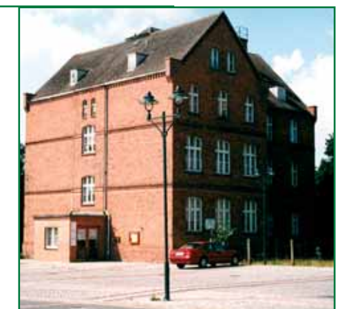
7 Alte Schule

Daneben konnte auch „baugebundene Kunst“ gefördert werden. So entstand unter anderem das Bronzerelief „Verwehte Blätter“, das die Geschichte der Gemeinde Löcknitz von 1100 – 2000 n. Chr. würdigt.