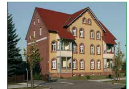
4 Ernst-Thälmann-Straße 14

Auch am Markt „tut sich was“. Die „Alte Schule“ wird zum „Haus für die Bürger“ umgebaut und saniert. Neben Bibliothek und Sanierungsbüro haben alte und junge Löcknitzer künftig Raum für Arbeit und Gestaltungsmöglichkeiten im Zentrum unserer Gemeinde.