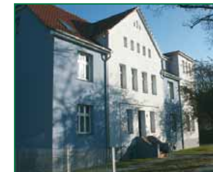
3 Chausseestraße 37