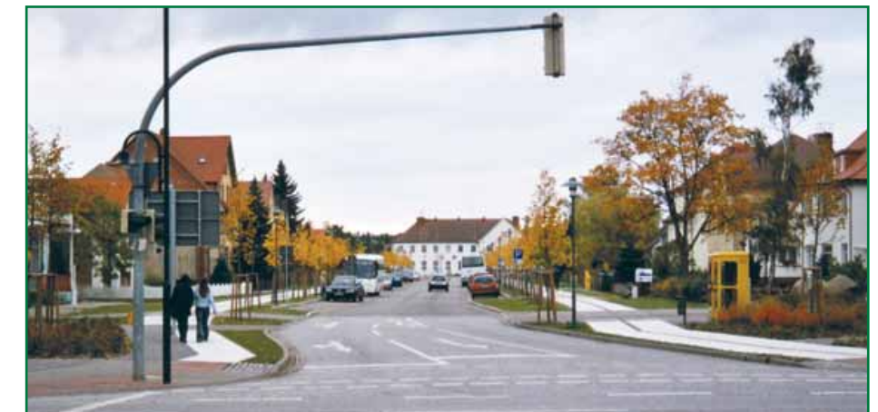
1 Erschließung der Ernst-Thälmann-Straße

Siehe auch Plan Seite 17: Künftige Schwerpunkte der Sanierung.