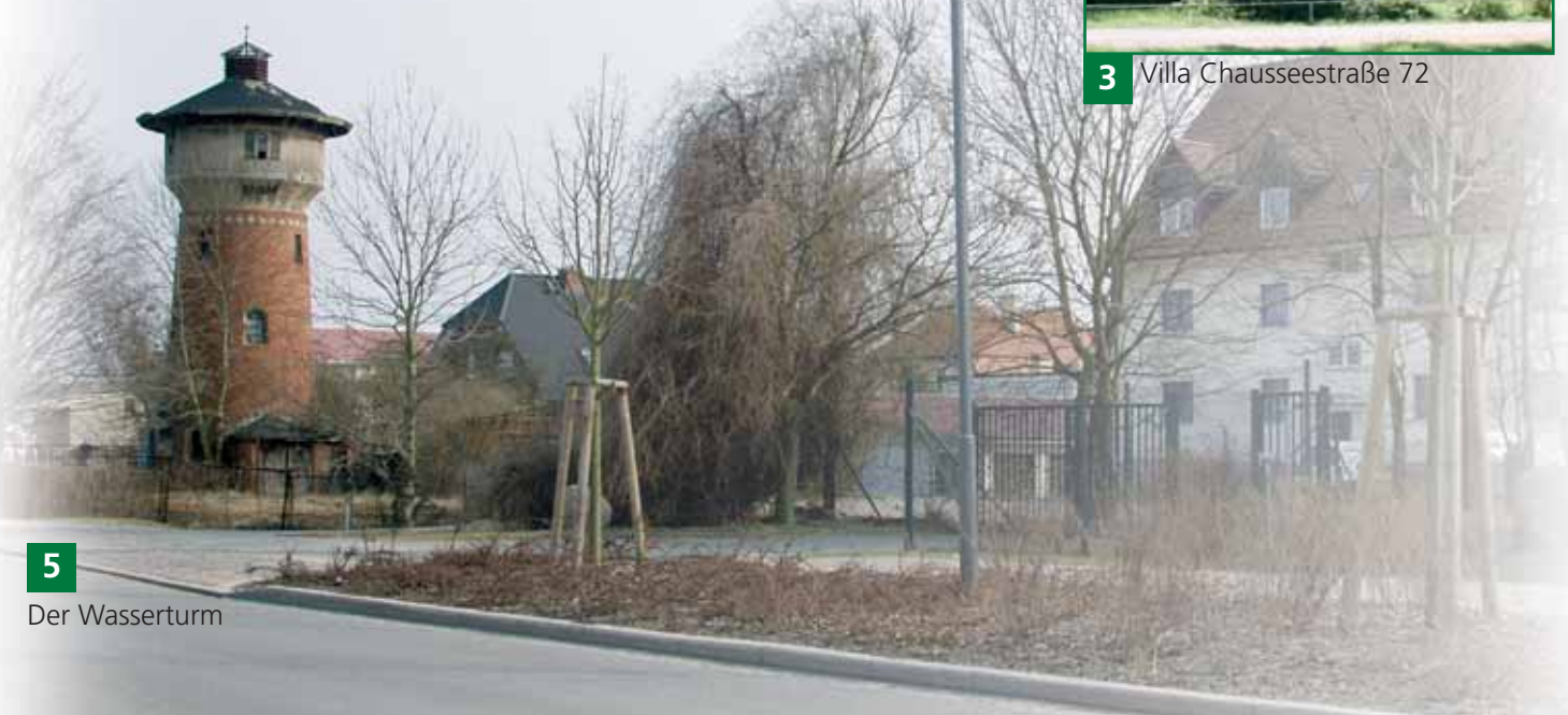
5 Der Wasserturm

Wir würden uns freuen, wenn wir, unter Mithilfe und Unterstützung der Bürgerinnen und Bürger, Löcknitz weiterhin als lebens- und liebenswerten Ort ausbauen und gestalten können.