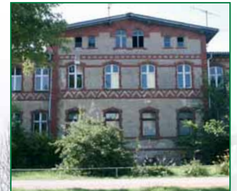
3 Villa Chausseestraße 72