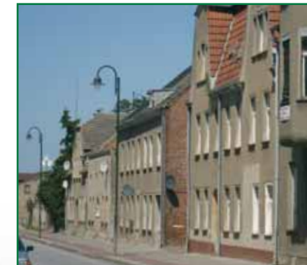
4 Häuserzeile Chausseestraße 8 -12

Durch die Realisierung vieler privater und öffentlicher Sanierungsmaßnahmen hat sich das Löcknitzer Ortsbild schon positiv verändert, aber vieles steht auch noch an. Dringend notwendige Sanierungsobjekte sind z. B. der Wasserturm, das Kaufhaus, Gebäude in der Chausseestraße und verschiedene Straßenzüge.