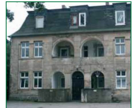
1 Villa Chausseestraße 71