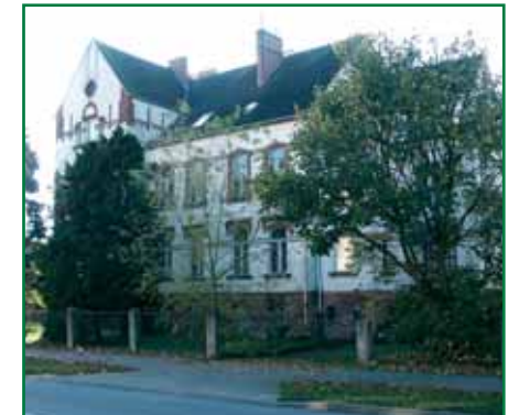
2 Chausseestraße 69